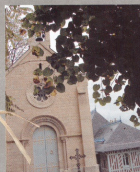
The chapel St. Clair was built 150 years ago.

This room is situated in an adjoining building with beautiful views of the Seine. 125 € at 140 €.